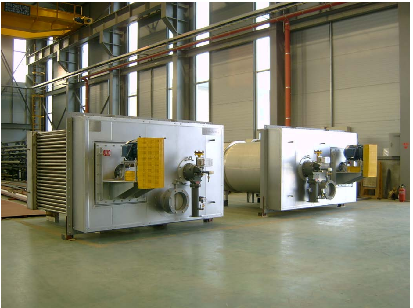
"Super Saver 90" Heat Exchanger

최고 사용온도가 350 도 C 로, 열매 나 스팀 으로는 불가능한 높은 온도를 얻을 수 있습니다.