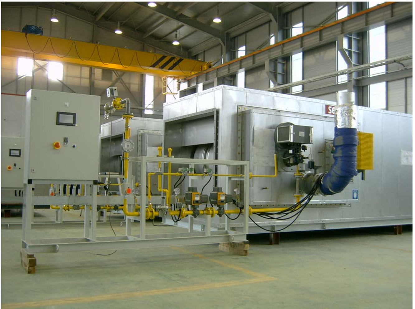
"Super Saver 90" Air Heater Live Fire Performance Test