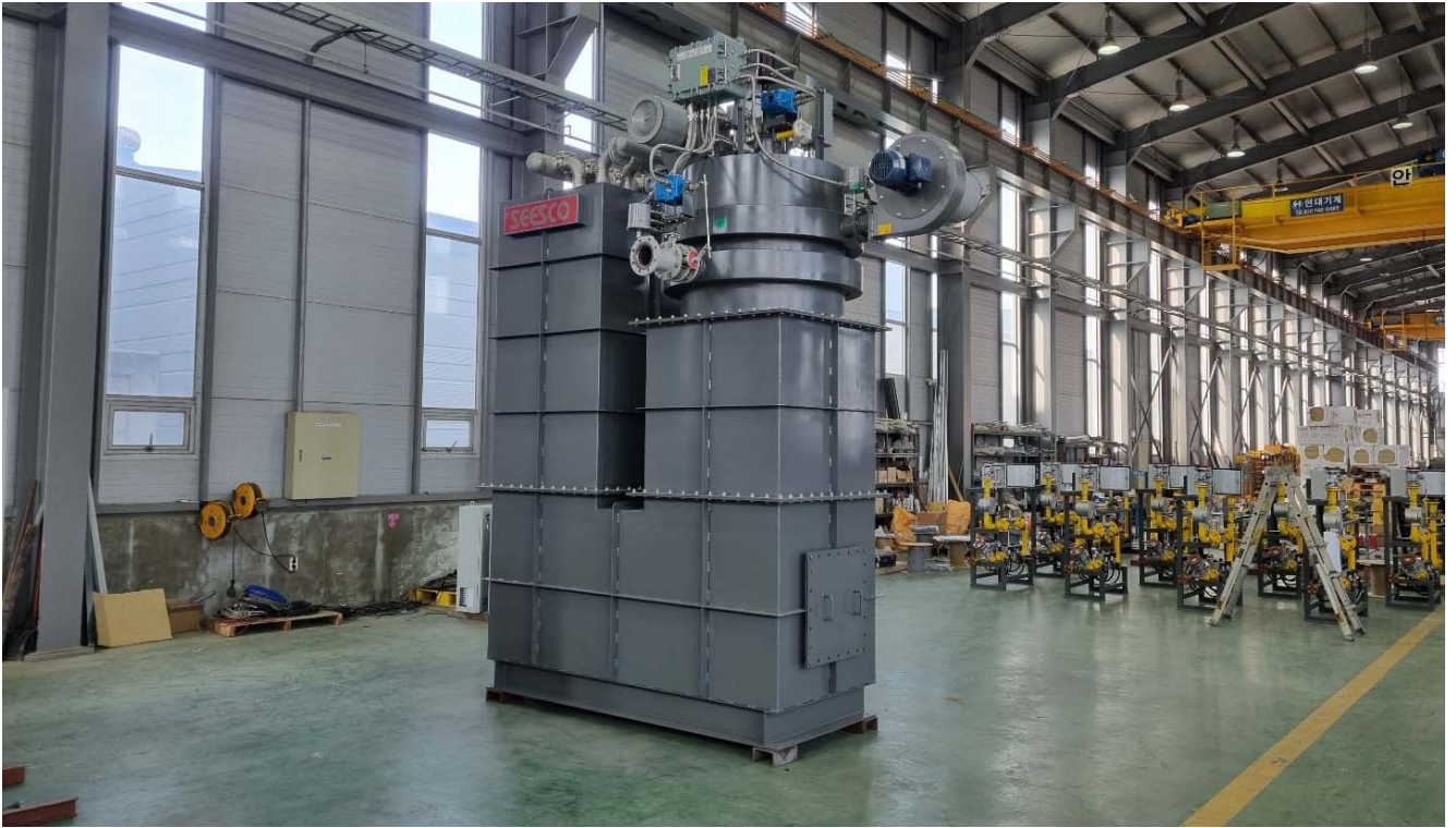
Pre Assembled Off Gas Incinerator & Media Fire Tube